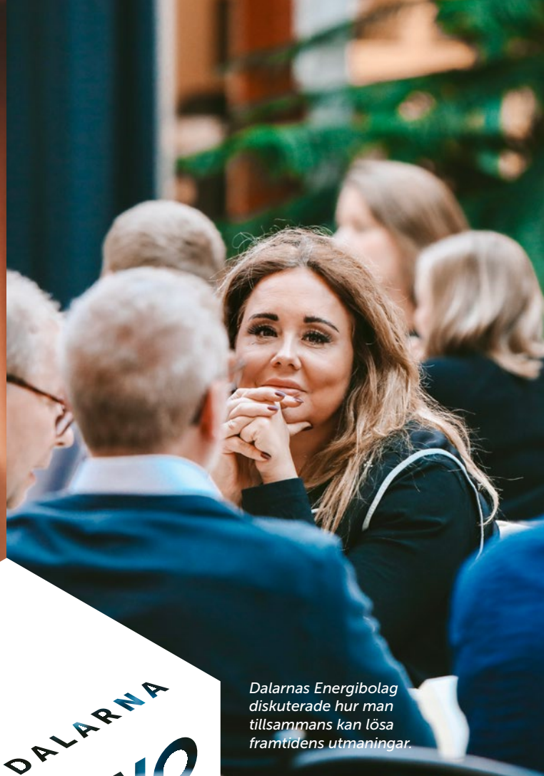
Dalarnas Energibolag diskuterade hur man tillsammans kan lösa framtidens utmaningar.