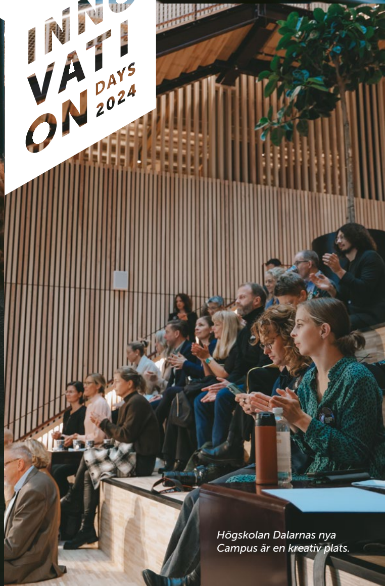
Högskolan Dalarnas nya Campus är en kreativ plats.