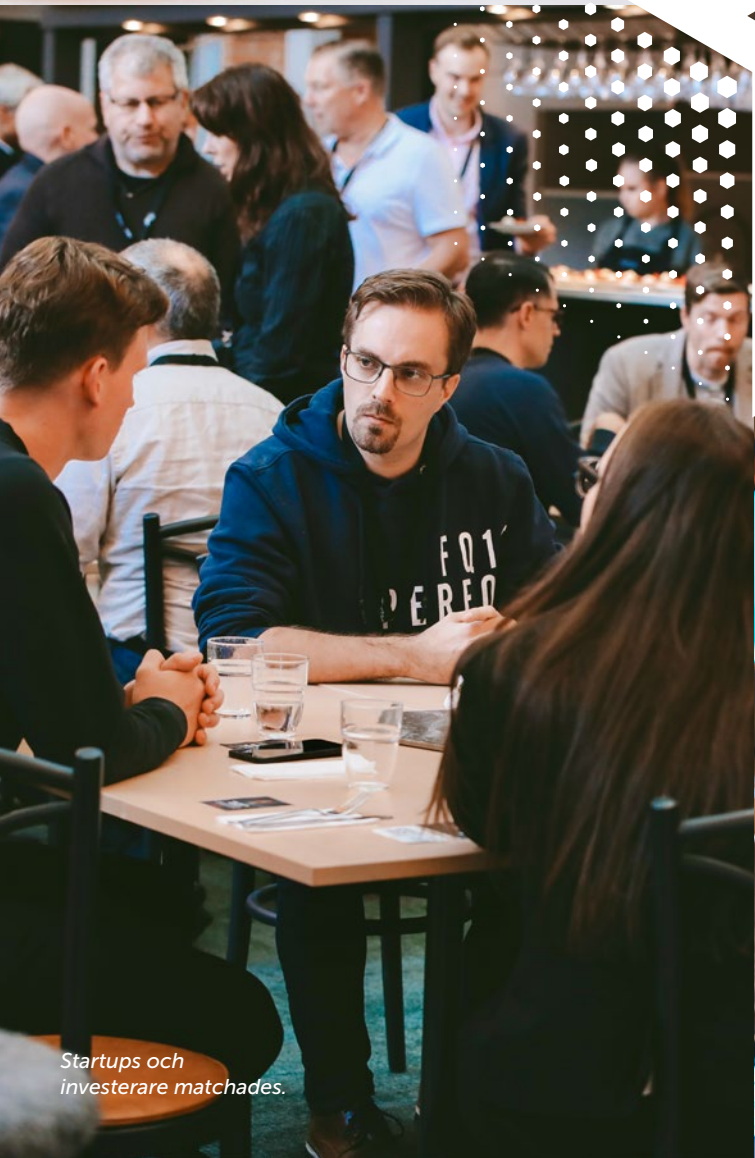
Startups och investorerare matchades.