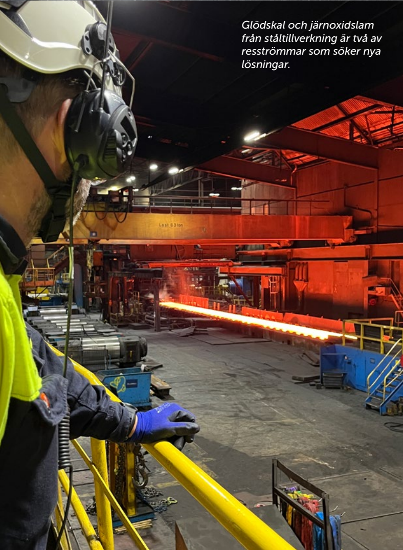
Glödskal och järnoxidslam från ståttillverkning är två av resströmmar som söker nya lösningar.