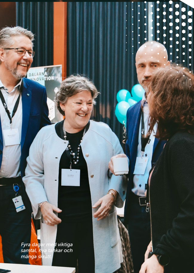
Fyra dagar med viktiga samtal, nya tankar och många skratt.