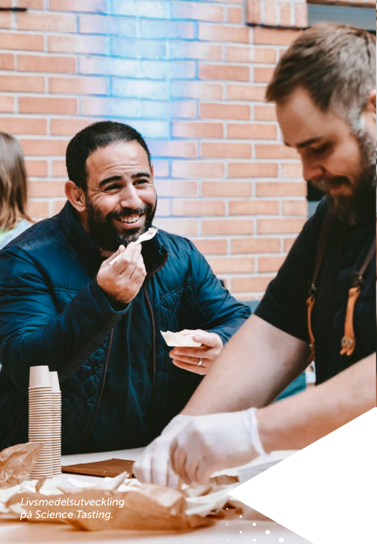
Livsmedelsutveckling på Science Tasting.