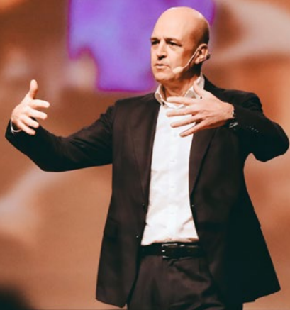
Fredrik Reinfeldt gav en omskakande omvärldsspaning under Daladagen.